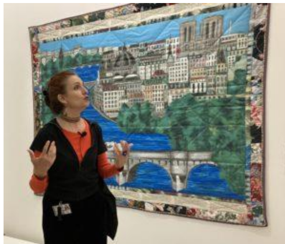
« Wedding on the Seine » - Toile narrative nommée « Quilt » - 1991.

Elle a un domaine artistique extrêmement vaste et diversifié, allant de la peinture aux courtèpointes, de la sculpture aux livres d'enfants.