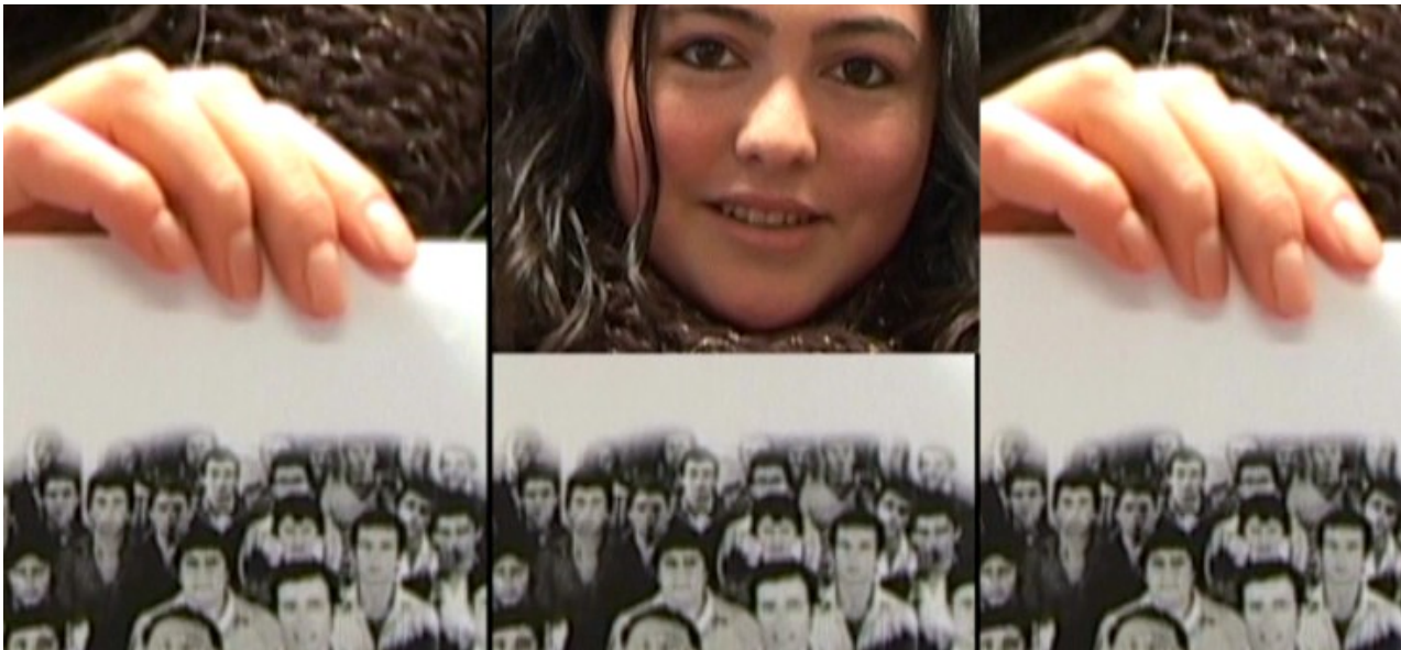
@Pierre Garbolino/Petits arrangements avec la vie

Le travail de création est intimement lié aux projets menés sur un territoire. La parole écoutée, suscitée, questionnée, transformée, redonnée sont les étapes de création. Un processus artistique qui se nourrit, s'attarde, met en lumière les récits de femmes et d'hommes d'aujourd'hui : Raconter l'histoire de notre société contemporaine à hauteur de femme et d'homme. Fouiller nos mémoires individuelles et collectives. Explorer, l'intime et ses frontières, ce qui nous rend humain par la parole partagée. Interroger notre besoin de fiction, de sens, dans une écriture du présent nourrie d'histoires anciennes.